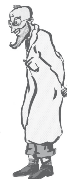
LE PETIT SCIENTIFIQUE